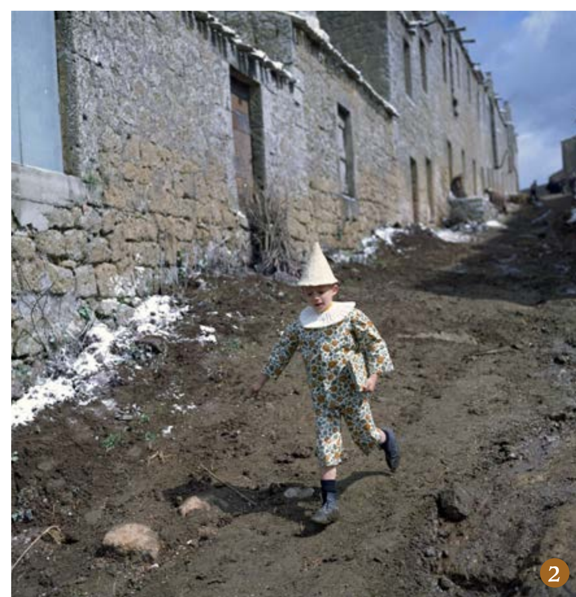
1. Farnese, Nino Manfredi sul set de Le avventure di Pinocchio di Luigi Comencini (1972)

Farnese, Nino Manfredi on the set of Le avventure di Pinocchio by Luigi Comencini (1972)